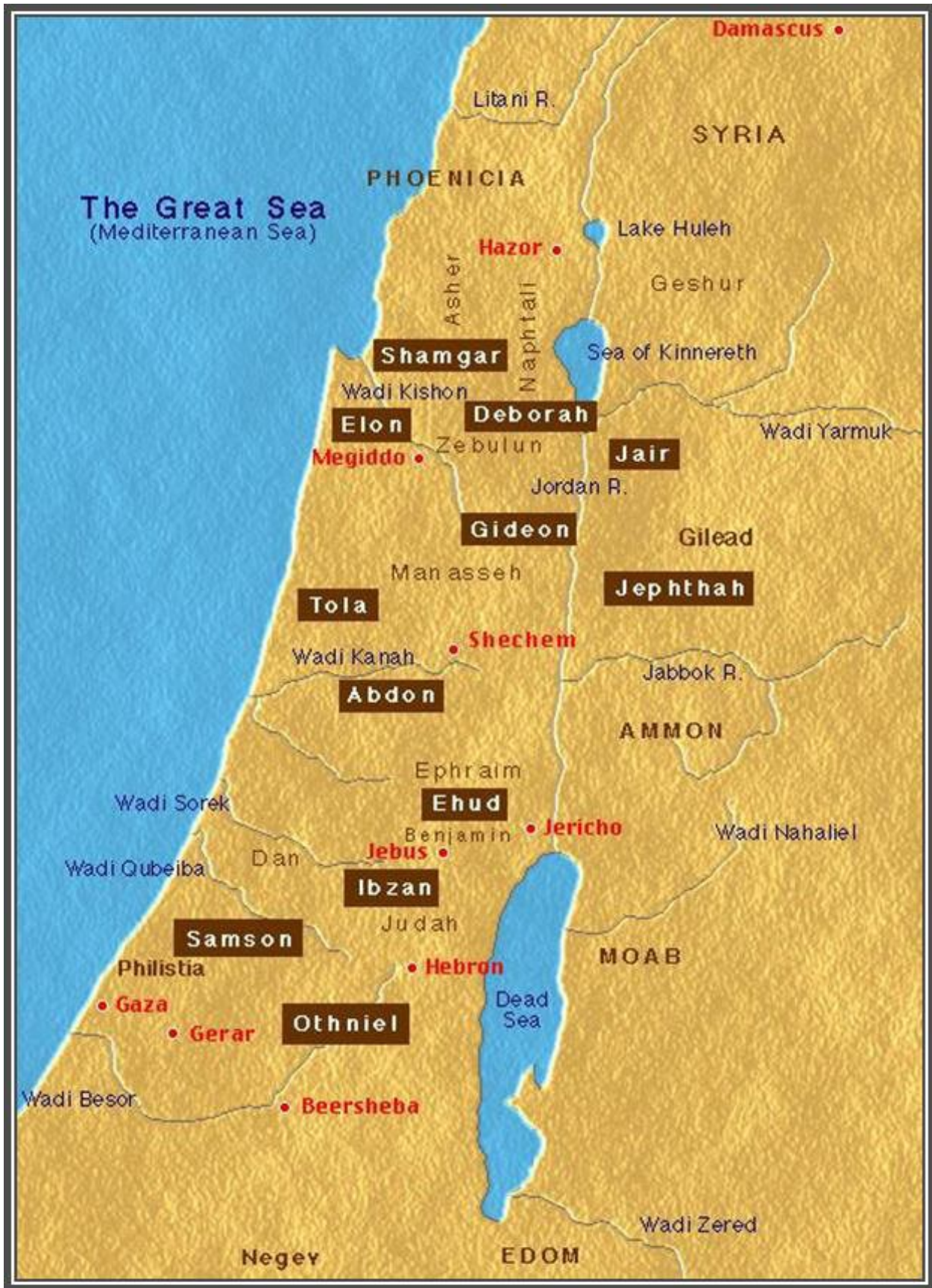
Fig 3. The 12 Judges and Locations