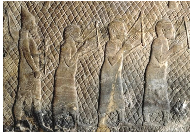
Palace of Sancherib 704-681 B.C., Prisoners playing lyres.

תהלים קל"ז, ו: תְּדַבֵּק לְשׁוֹנֵי לַחֲבִי אִם לֹא אֲזַכְּרֵכִי אִם לֹא אֲעֲלֶה אֶת יְרוּשָׁלַם עַל רֹאשׁ שְׁמַחְתִּי: איכה ד', ד: דְּבַק לְשׁוֹן יוֹנָק אֶל חֹפוֹ בְּצִמָּא עוֹלְלִים שְׂאֵלוֹ לָחֶם פֶּרֶשׁ אֵין לָהֶם: